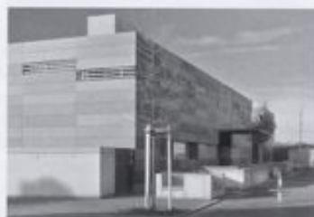
Seite 178 / page 178 Kindertagesstätte in Darmstadt Day-Care Centre for Children in Darmstadt

• Holzfensterarbeiten: Longato Luciano & C., Monastier di Treviso Tel.: +39 0422 798443 • Aluminiumarbeiten: Aisa srl, Soligo Tel.: +39 0438 841934 Fax: +39 0438 990702 www.aisasrl.com • Trockenbau: Arcadia Soluzioni srl, Trevignano Tel.: +39 0423 670406 Fax: +39 0423 670066 www.arcadiasoluzioni.it • Böden: Metope srl, Montebelluna Tel.: +39 0423 22322 Fax: +39 0423 301920 • Malerarbeiten: Edilcolor srl, Montebelluna Tel.: +39 0423 602253 www.edilcolorsl.it • Pflanzen: Bettiol srl, Arcade Tel.: +39 0422 874115 Fax: +39 0422 874052