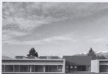
Seite 176 / page 176 Krippe und Kindergarten in Covolo Crèche and Nursery School in Covolo