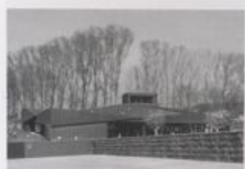
Seite 182 / page 182 Vorschule in Marmoutier Nursery School in Marmoutier

• Fassade, Dämmung und Foamglas: J. Reinisch & Co. KG, Bozen Tel.: +39 0471 307700 www.reinisch.it • Glasfassade: Frener & Reifer Metallbau, Brixen www.frener-reifer.com • Elektro- und Photovoltaikanlage: Technology Innovation KG, Bruneck www.ti-technology.it • Sanitäranlage: Atzwanger AG, Bozen www.atzwanger.net • Baumeister: Iobstraibizer & ci srl, Roncegno www.iobstraibizer.com • Zimmermann und Spengler: Raffiner KG, St. Michael/Eppan Tel.: +39 0471 662164 • Glasfassade: Frener & Reifer, Brixen www.frener-reifer.com • Glastrennwände: Barth Innenausbau KG, Brixen www.barth.it • Innentüren: Gogl GmbH, Gasteig Tel.: +39 0472 779178 www.gogl.it