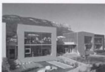
Seite 180 / page 180 Kindergarten in St. Michael/Eppan

• Holzfertigteile: Finnforest Merk, Aichach Tel.: 08251 908-0 www.finnforest.de • Fassadentafel: Eternit AG, Berlin Tel.: 01805 651651 www.eternit.de • Fassadentafel und Dachterrasse: Zimmerei Arno Veit, Otzberg Tel.: 06162 968239 • Fassade Stahlkonstruktion: J. Pleyer GmbH, Ober-Ramstadt Tel.: 06154 2536 www.pleyer-gmbh.de • Fenster: Schreinerei Weiß, Rommerz www.schreinerei-weiss.de • Dach: Willy A. Löw AG, Bad Hornburg www.loew-ag.de • Linoleumböden: Armstrong DLW, Bietigheim-Bissingen www.armstrong.de • Innenausbau: Fa. Leuchtenmüller, Miltenberg am Main www.leuchtenmueller.de