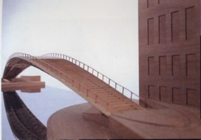
CHIPPERFIELD nuovo cimitero