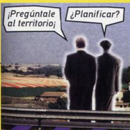
un pannello della Mostra Metapolis a Barcellona