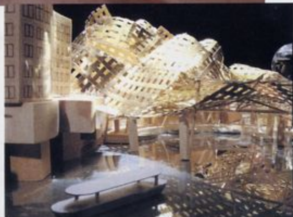
GEHRY nuovo aeroporto