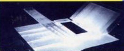
Tuffi-Lauro Concorso per un nuovo stadio in America