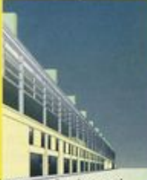
Progetto di concorso Eur Congressi