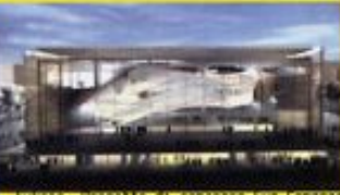
Ruskas, Progetto di concorso Eur Congressi

Quaderni della Rivista Italiana d'Architettura periodico Anno X N°4/20 nuova serie - 1999, giugno Edizioni: Erid' A/Kappa In redazione Pino Scaglione [direttore responsabile] con: Ippolita d' Ayala, Santo Giunta, Massimo Locci, Julia Vicioso e con la collaborazione di Marianonietta Liguori