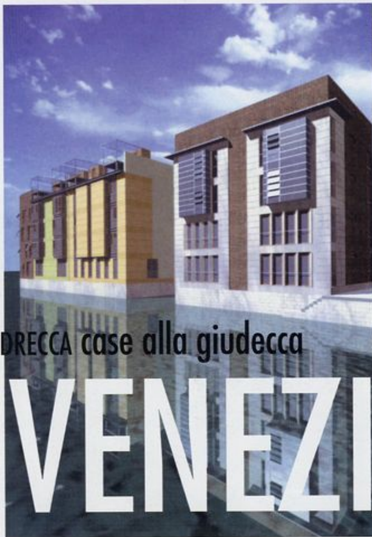
DRECCA case alla giudecca