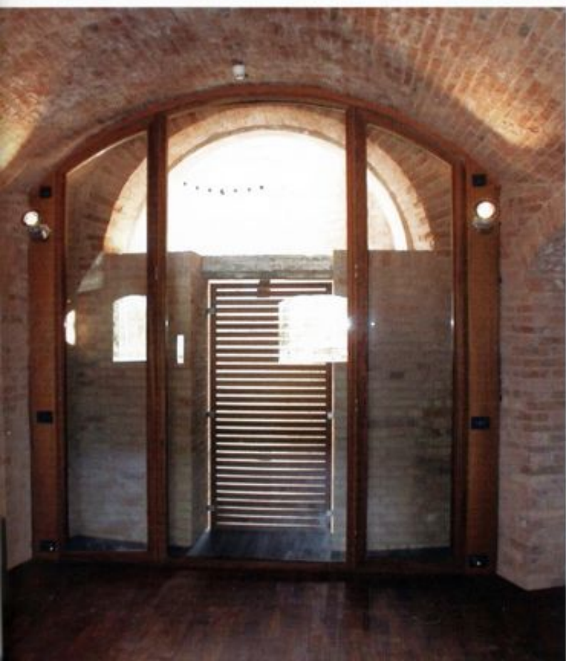
Visione d'insieme dei serramenti esterni. Total view of the external windows and doors.