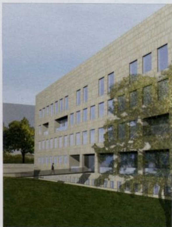
VISTA DALLA PIAZZA INTERNA