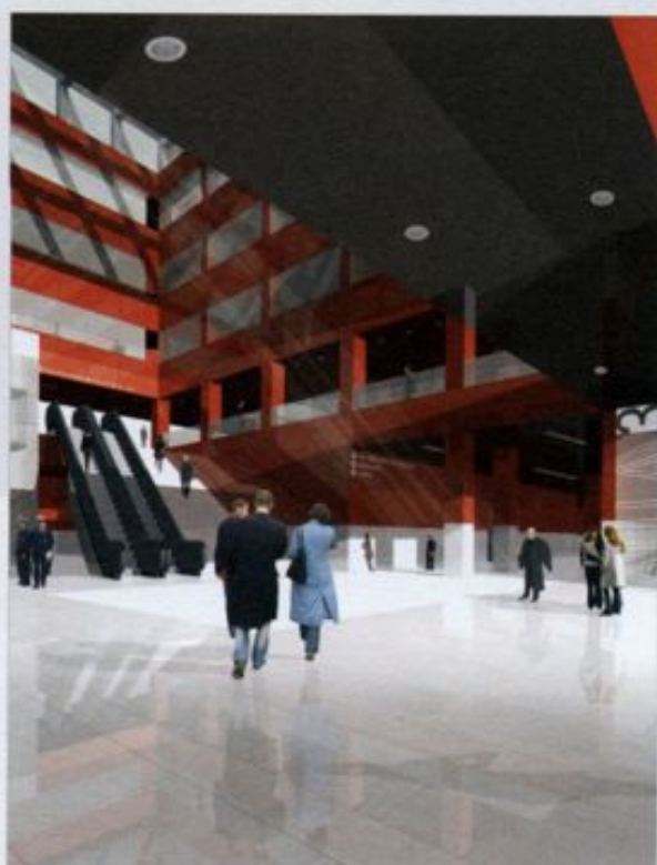
VISTA DELLA HALL INTERNA