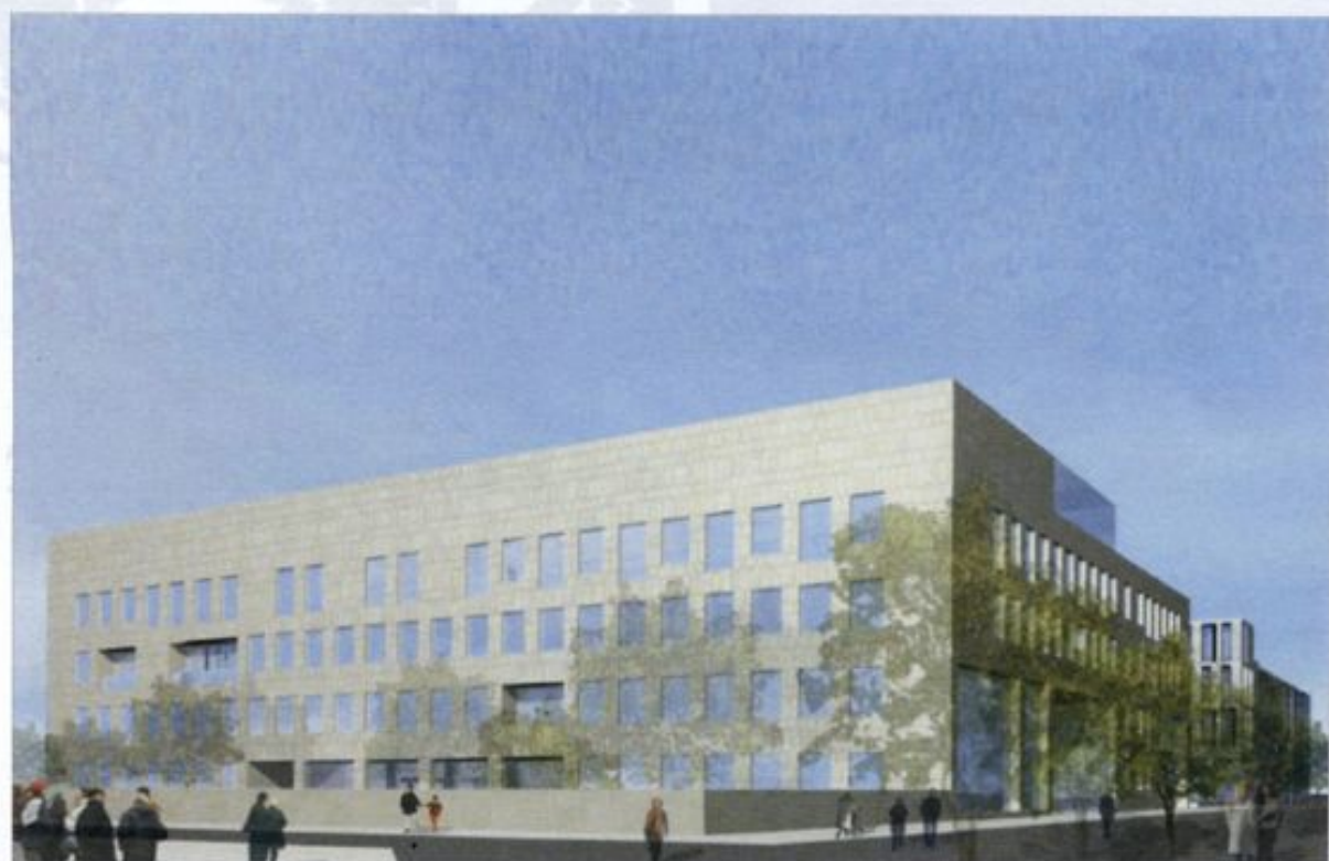
VISTA DA VIA BRIGATA ACQUI