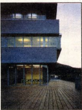
■ Il progetto di 5+1.

A l via la terza edizione della Festa per l'Architettura di Milano. Due mesi di eventi, mostre, film, studi di architettura che aprono le porte al pubblico e numerosi incontri sulla cultura del progetto. Tra le iniziative, grande attesa per la consegna della Medaglia d'Oro all'Architettura italiana 2006 (24 maggio), iniziativa della Triennale di Milano con la Darc, che con cadenza triennale spinge a riflettere sulle nuove e più interessanti opere costruite in Italia. Ci sarà una Medaglia d'Oro all'opera, una Medaglia d'Oro all'opera prima, un premio speciale alla committenza e tante menzioni d'onore.