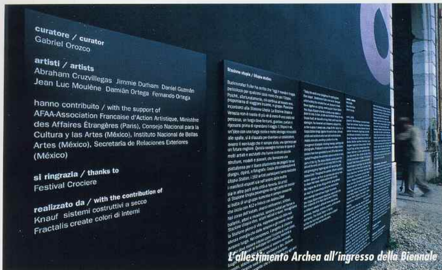
l'allestimento Archa all'ingresso della Biennale

Progetto e direzione dei lavori: ARCHEA ASSOCIATI Progetto grafico: TASSINARI E VETTA Fornitura gesso rivestito: KNAUF Fornitura Vernici: FRACTALIS Fornitura maschere: EUROSTAND Realizzazione portali: EDILTECNO 2000-Jesolo (VE) Pitturazione dei portali: PIBIEFFE s.n.c.