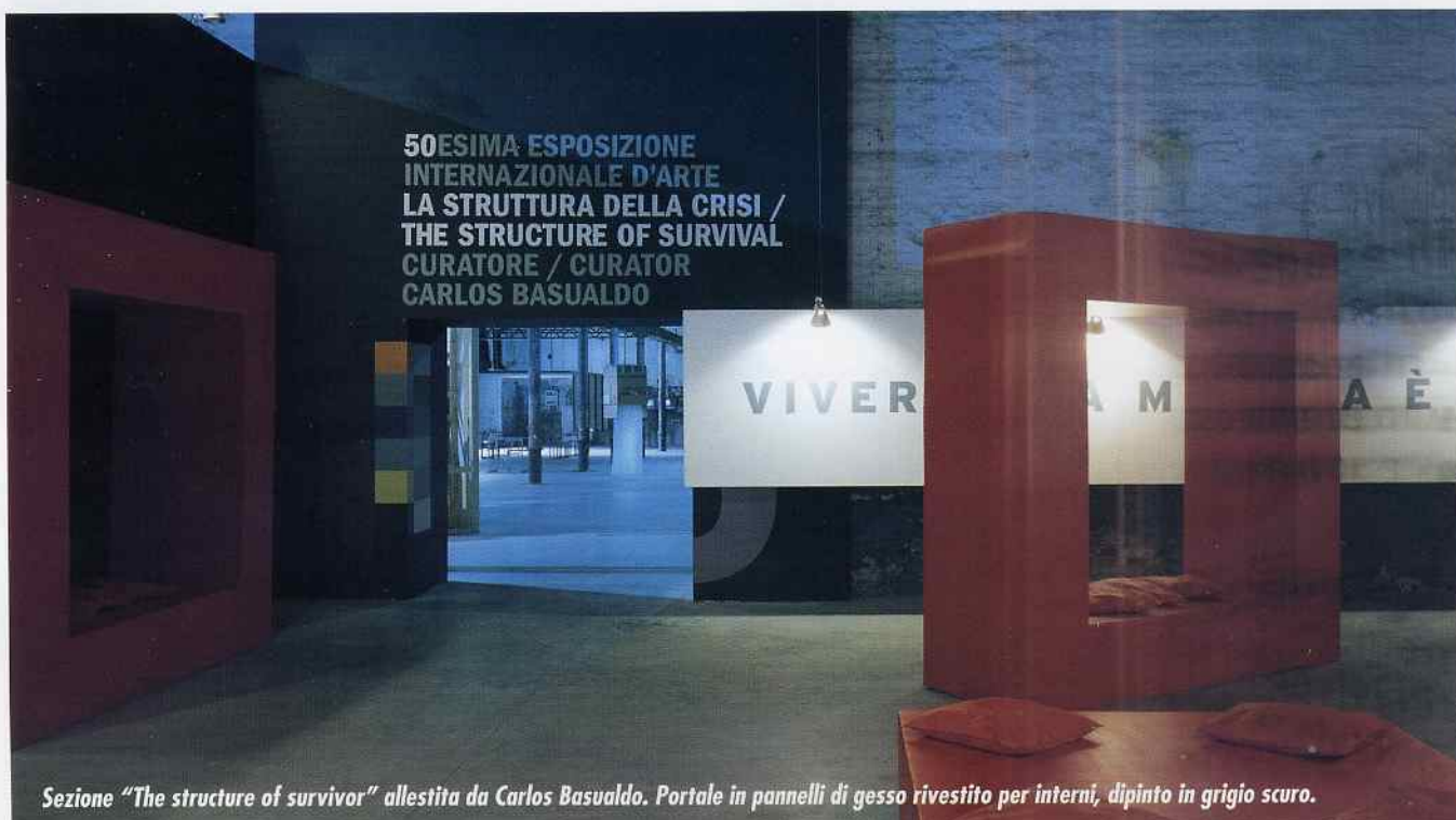
Sezione "The structure of survivor" allestita da Carlos Basualdo. Portale in pannelli di gesso rivestito per interni, dipinto in grigio scuro.