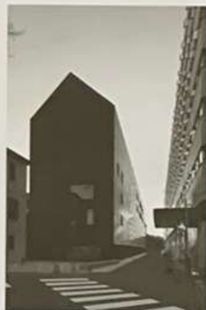
Stavba soudu, Benátky, Itálie, 2012

Takže je fundamentalní záležitost. Neexistuje staré a nové. Tímto přiblížím se řadíme k východní kultuře. Myslíme si, že vlnično se nepřetržitě transformuje. Všechno je součástí velmi dlouhého procesu, který vytváří most od každého okamžiku k jeho budoucnosti. Když mluvíte o starém a novém, mělné nám to žádný smysl. Naše činnost je součástí procesu, který neustále proměňuje mělné, lid, jejich životy, jejich schopnosti, a pokud zahrnete tento proces do architektonického návrhu, tak je to prolné a ebohat. Vše se stále pohybuje, nemůže přestat. Není nic starého, co to vůbec znamená být starý? Co chcete uchovat? Budovu z doby, kdy byla postavena? Vy ale nevíte, jak byla postavena, protože je postava transformoval lid, klima, války... Protože