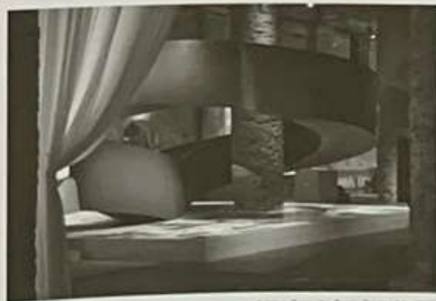
Stavba soudu, Benátky, Itálie, 2012