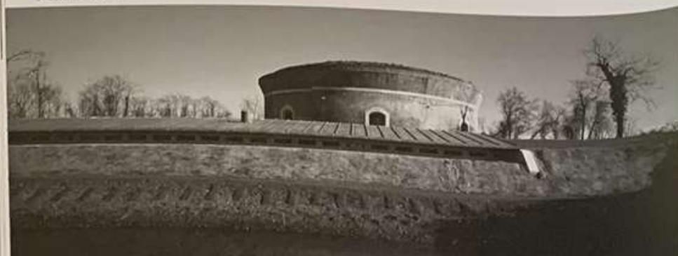
Museum Enzo Mari, Ferrara, Itálie, 2004