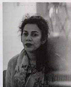
Budování znalostí, budování komunity Anupama Kundoo (1967)

Vystudoval architekturu na curyšské polytechnice a od roku 2003 vede samostatný architektonický ateliér Raphael Zuber v Churu, který etešel hned po ukončení studia. Využoval na několika architektonických školách, momentálně hostuje na Fakultě architektury ETH v Curychu. U některých staveb není pouze architektem, ale i investorem. Klade velký důraz na prezentaci a detailní řešení svých návrhů. Mezi jeho významné projekty patří škola a školka v Gronu, bytový dům v Domat/Ems, Etnografické muzeum v Neuchâtelu nebo univerzitní kampus SUPSI v Mendrisiu.