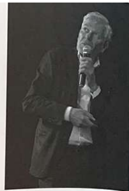
O pozici – funkci – pořádku a svobodě krásy