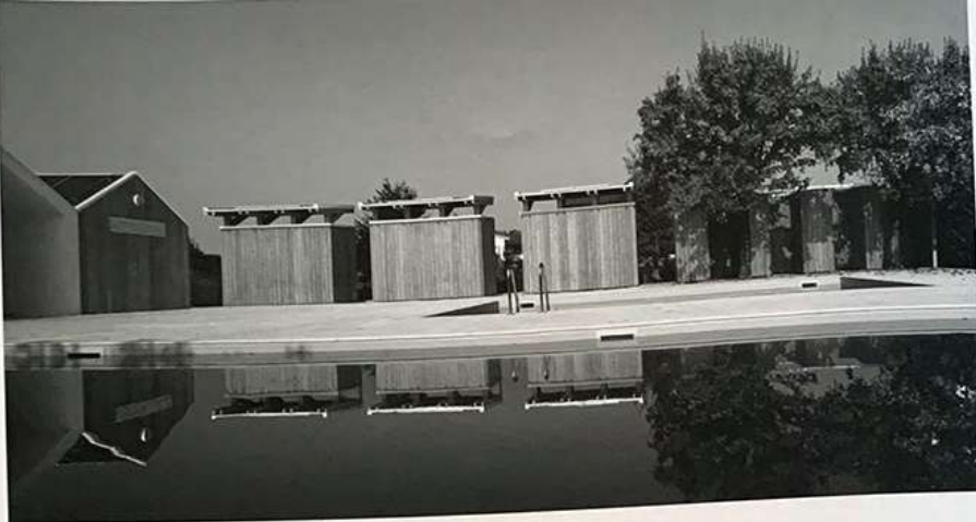
Školní centrum, Fontaniva, Itálie, 2013

neexistuje pravda o dějinách, neexistuje ani pravda o tom, co děláte. Zajmete-li pokorný přístup, i vy se stanete součástí procesu a přebíráte zodpovědnost za jeho transformaci. Abyste se zapojili do tohoto procesu transformace, musíte mít vztah s komunitou a kontextem, vztah s lidmi a materiály.