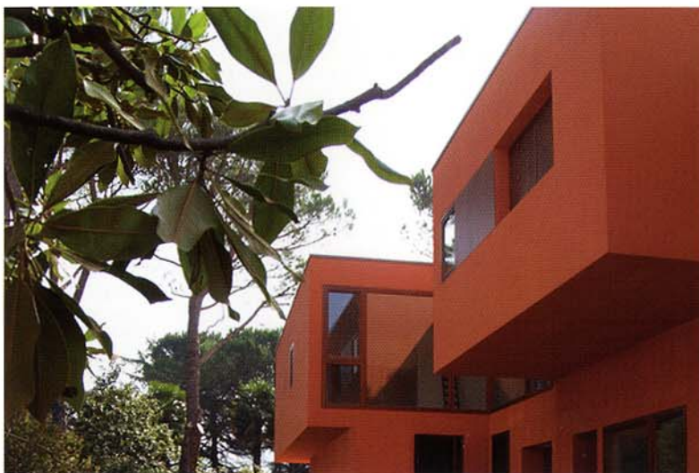
C+S Associati, 2008, Residenze sostenibili a Fognano, Ravenna

risolvibili se non con continui cambi di residenza che, al contempo, riducono la percezione di appartenenza ad un luogo rintracciabile nel significato del termine "abitare", letteralmente possedere un luogo.